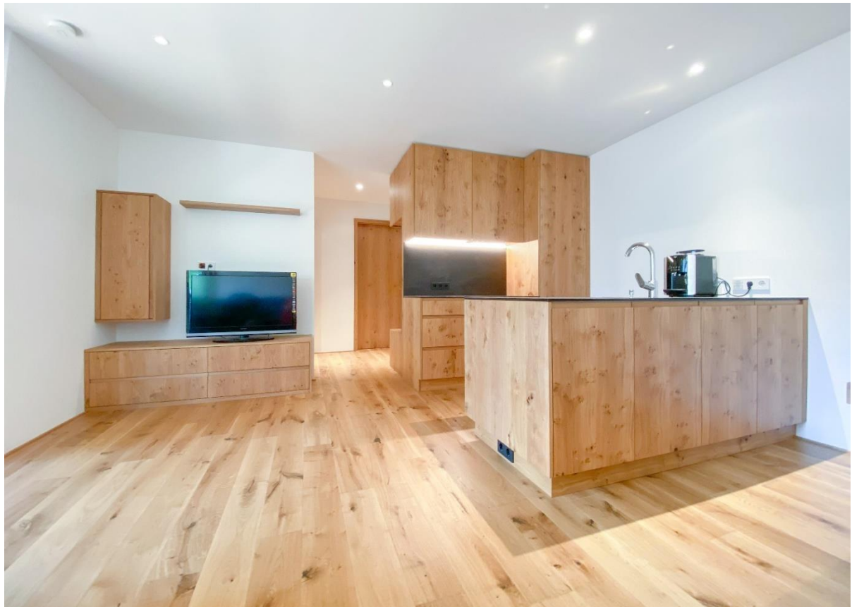
Beispiel: Kochen / Wohnen