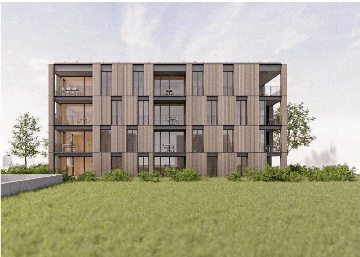
Ansicht Nord West