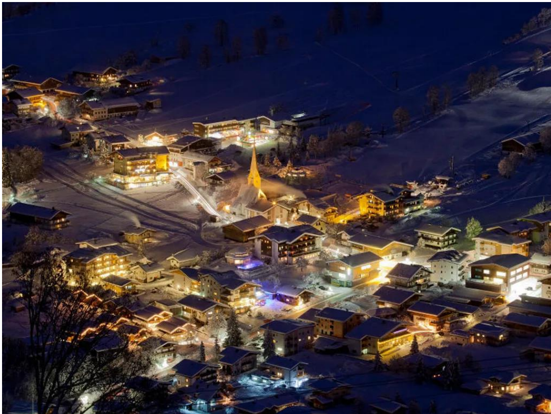
Niererau by night