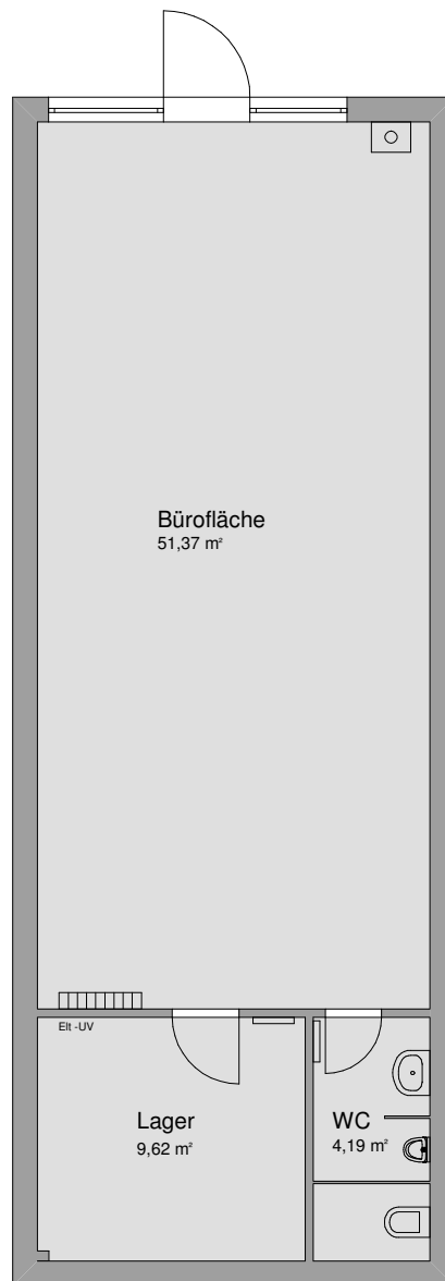
Mietereinheit 11 65,18 m²