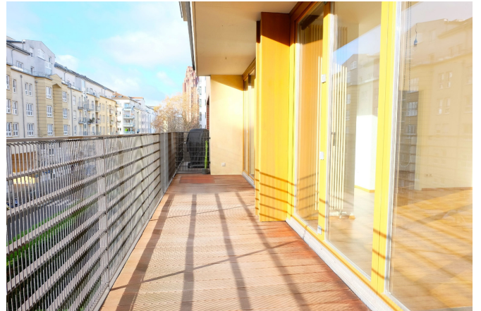
Balkon Bild 1