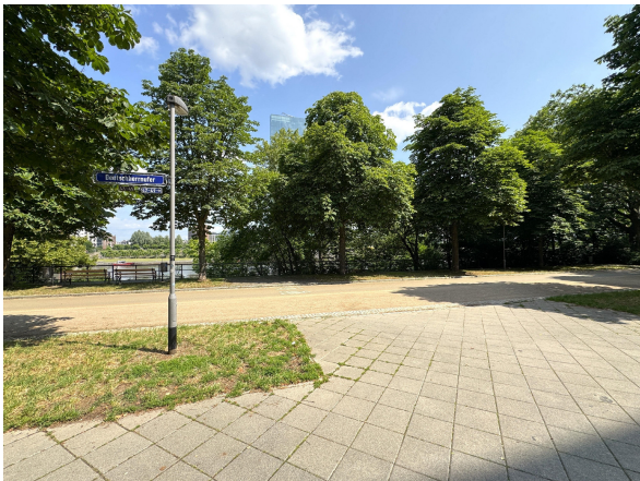
Bereich vor dem Haus