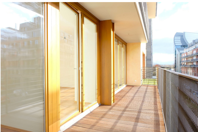
Balkon Bild 2