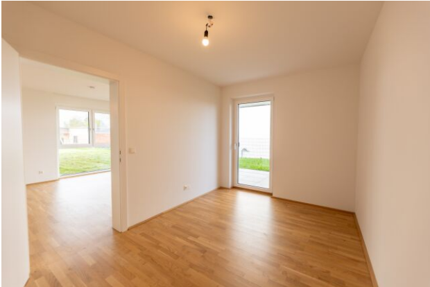
Panoramavillen H2 TOP 2