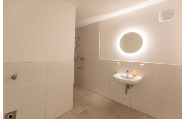
Panoramavillen H2 TOP 2