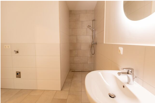
Panoramavillen H2 TOP 2