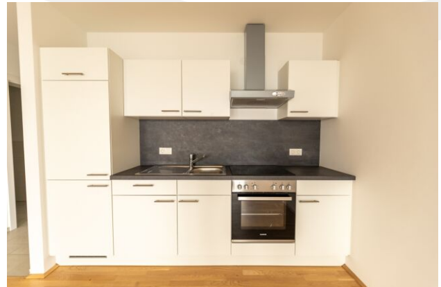
Panoramavillen H2 TOP 2