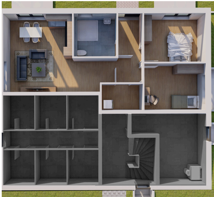
Erdgeschoss Wohnung Nummer 3