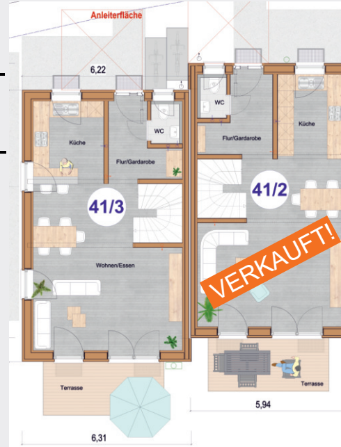
Darstellung nicht maßstäblich, unverbindlicher Grundriss

++ moderne Architektur ++ tolle Grundrisse mit bis zu 6 Zimmern und 2 Bädern ++ ca. 121 - 124m 2 Wohnfläche ++ 2 Kfz-Stellplätze ++ Süd-West-Terrasse mit Garten ++ Vollkeller ++ Top-Wärmepumpe ++ modernste Passivhaustechnik mit Erdwärmenutzung ++ Frischluft-Klima mit sommerlicher Kühlung ++ Solarstrom-Anlage mit Batteriespeicher ++ prima Verkehrsanbindung Rtg. Stuttgart + Aalen über die B29 + MEX (Haltestelle in Urbach) ++ günstige Finanzierung ++ Sommer-Highlight: Nähe zum Freibad & Natur ++ Einzug ab 08/2024 möglich ++