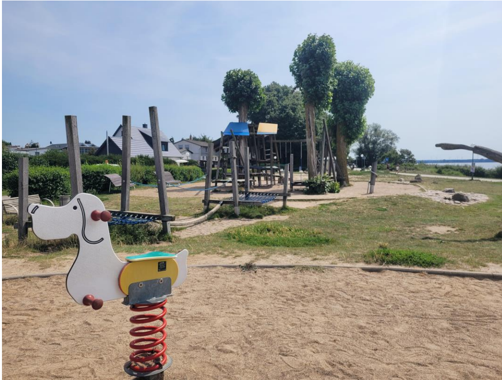
öffentlicher Spielplatz Haffpromenade