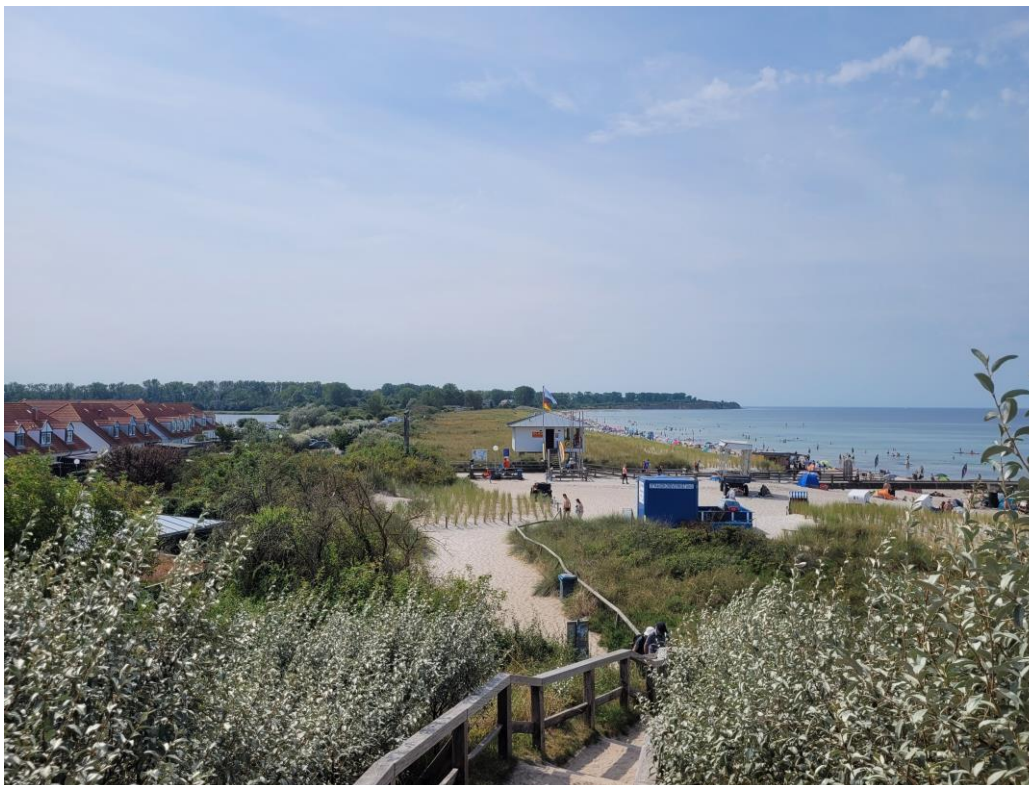
Panoramablick vom Aussichtspunkt Schmiedeberg