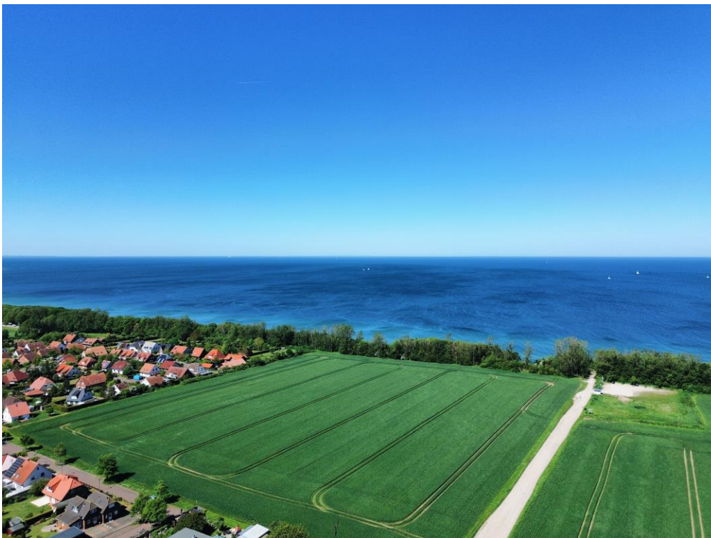
Luftbild Richtung Norden mit nahegelegendem Strandzugang