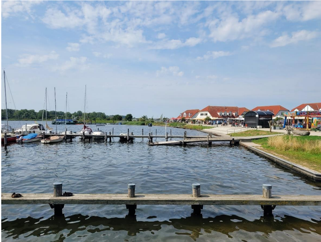
Hafen mit Blick auf den Haffplatz