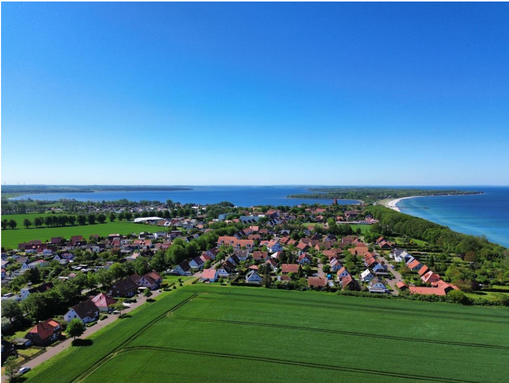
Luftbild Richtung Westen