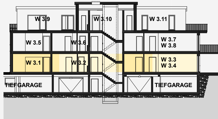
ÜBERSICHTSPLAN SCHNITT "GEBÄUDE 3"