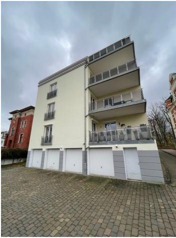
Außenansicht mit Tiefgaragenauffahrt