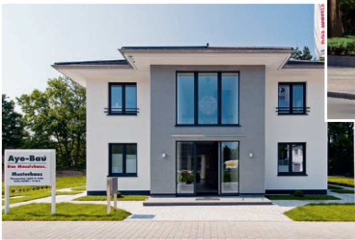
Musterhaus in Groß Glienicke