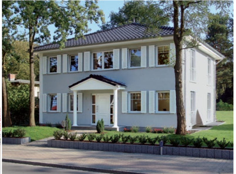
Musterhaus in Kleinmachnow