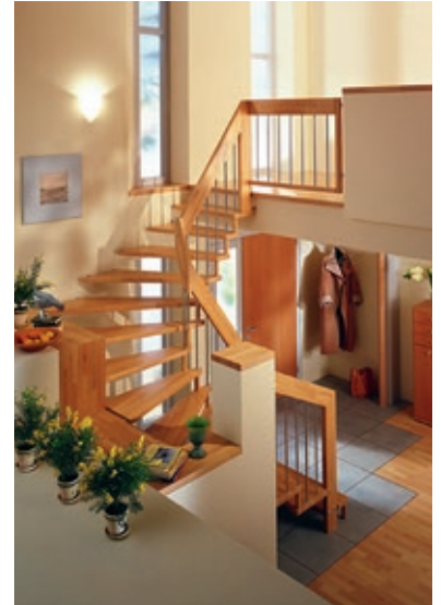
Abbildung enthält Sonderausstattung

Handlauftragende Holztreppe, in der Holzart Buche durchgehend verleimt, mit schallmindernd in der Wand gelagerten Trittstufen. Raumseitig werden die Stufen über den massiven Holzhandlauf und die Geländer-Stäbe gegenseitig verschraubt. Die Materialstärke der Trittstufen, Pfosten und der Handläufe beträgt ca. 44 mm. Die An- und Austrittspfosten sind rechteckig und 160 mm breit. Die Sprossen sind aus rundem Holz, d = 30 mm. Der Holzhandlauf ist rechteckig, 160 mm breit und hat oben gerundete Kanten. Die Holzflächen sind glatt und allseitig mit hochwertigem Lack versiegelt.