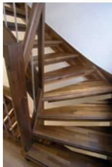
Abbildung enthält Sonderausstattung

Holztreppe, in der Holzart Buche durchgehend verleimt, bestehend aus zwei Wangen mit eingestemmten Trittstufen. Offene Ausführung, ohne Setzstufen. Die Materialstärke der Wangen, Trittstufen, Pfosten und Handläufe beträgt ca. 44 mm. Die Pfosten sind rechteckig und 120 mm breit. Die Geländerstäbe werden wahlweise als runde Holzspresse, d = 25 mm, oder aus rundem Edelstahl, d = 16 mm, ausgeführt. Der Handlauf ist aus Holz, rechteckig, 80 mm hoch und hat oben gerundete Kanten. Die Holzflächen sind glatt und allseitig mit hochwertigem Lack versiegelt.