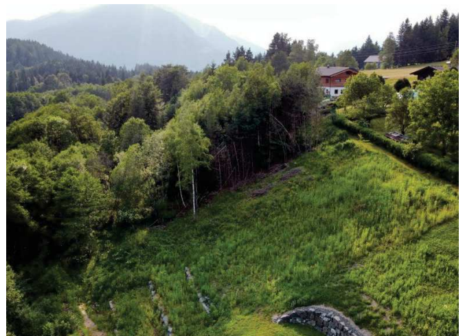
nach Westen 1