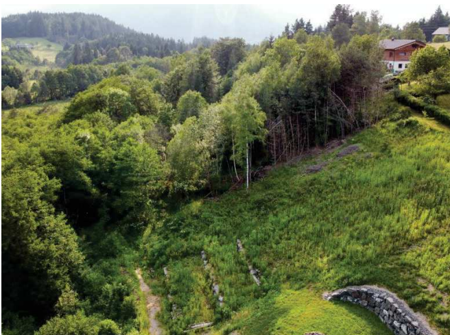
nach Westen 2