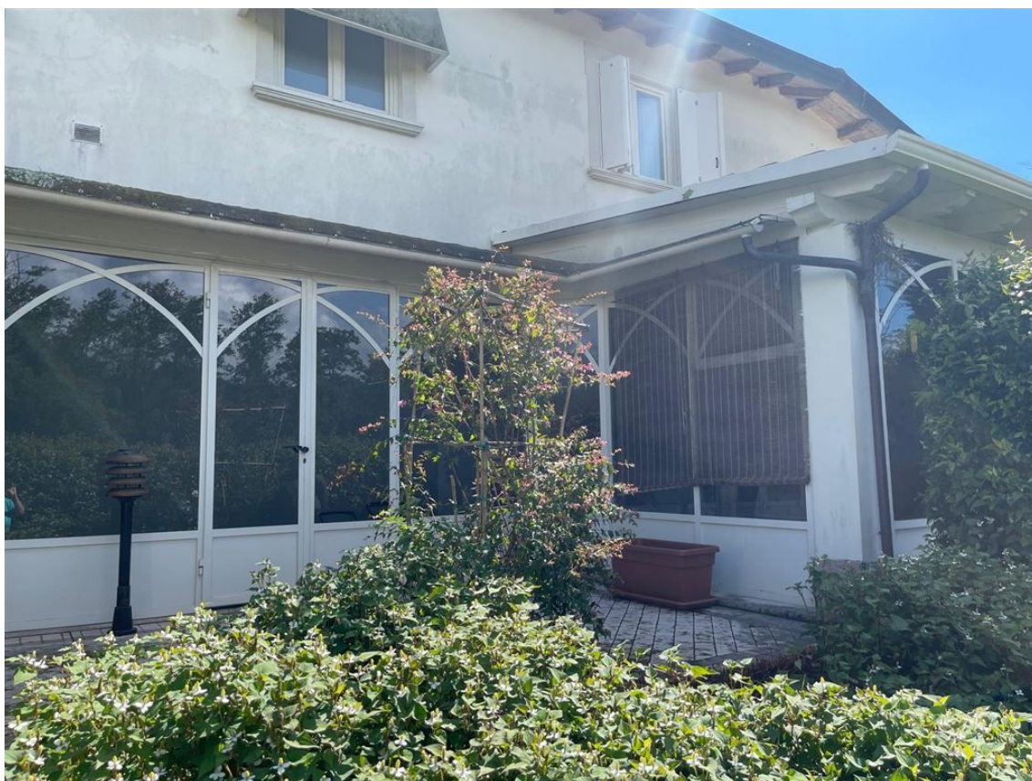
Villafranca Aula Villa komplett schlüsselfertig, 54028 Villafranca