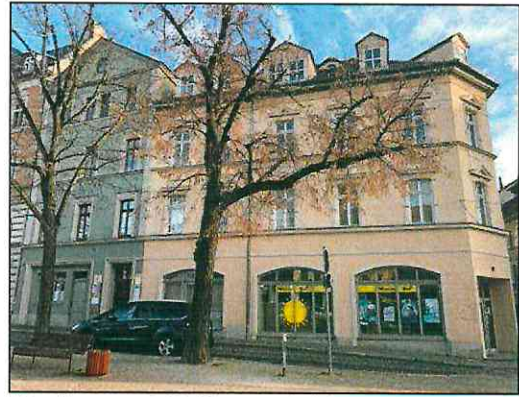
Vorder- und Seitenansicht