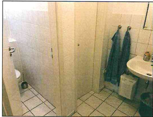
Sanitäranlage im 2.Obergeschoss