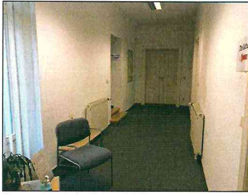
Gewerbeeinheit im 1. Obergeschoss