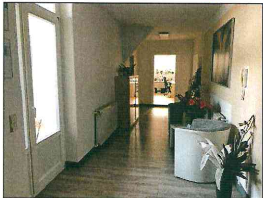
Gewerbeeinheit im 1.Dachgeschoss