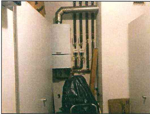
Etagenheizung der Gewerbeeinheit 2.OG