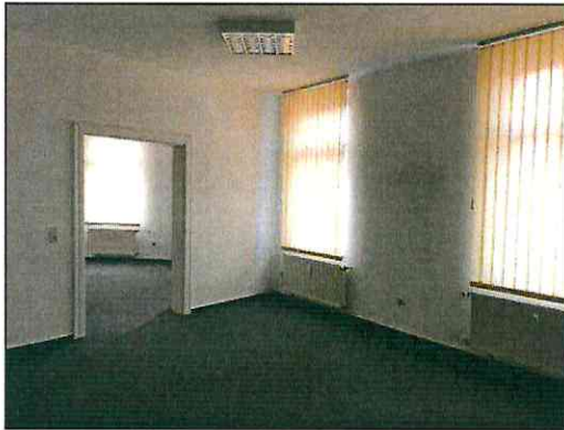
Büroraum im 1. Obergeschoss