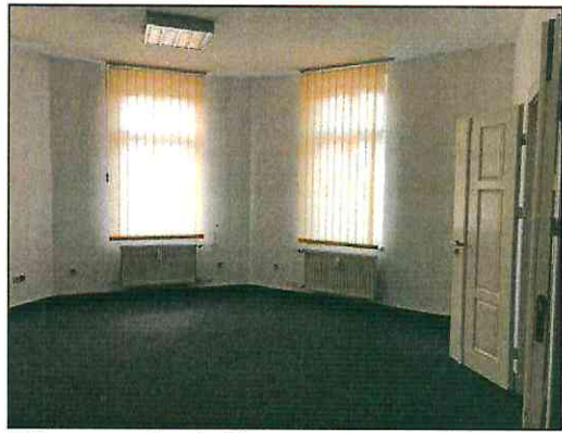
Büroraum im 1. Obergeschoss