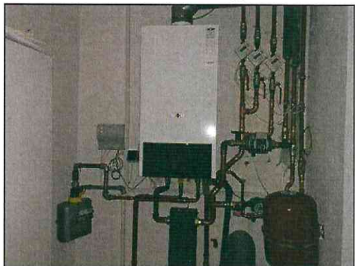
Etagenheizung der Gewerbeeinheit 1.DG