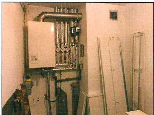
Etagenheizung der Gewerbeeinheit 1.OG