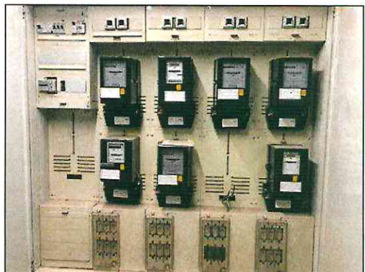
Sicherungskasten mit Stromzählern