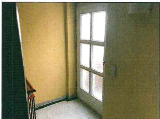
Zugang zur Wohneinheit im 2.DG