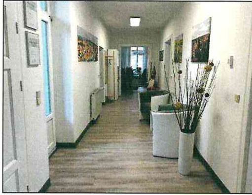
Gewerbeeinheit im 2.Obergeschoss