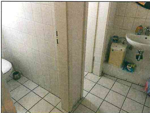
Sanitäranlage im 1.Dachgeschoss