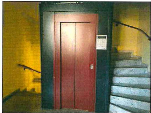
Treppenhaus mit Fahrstuhl