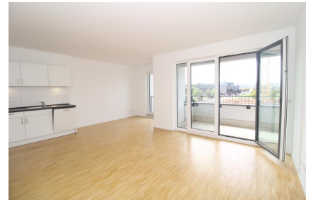
Wohnbereich mit Balkon

Kontaktieren Sie uns für einen Besichtigungstermin - wir freuen uns auf Sie!