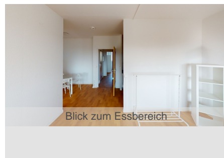
Blick zum Essbereich