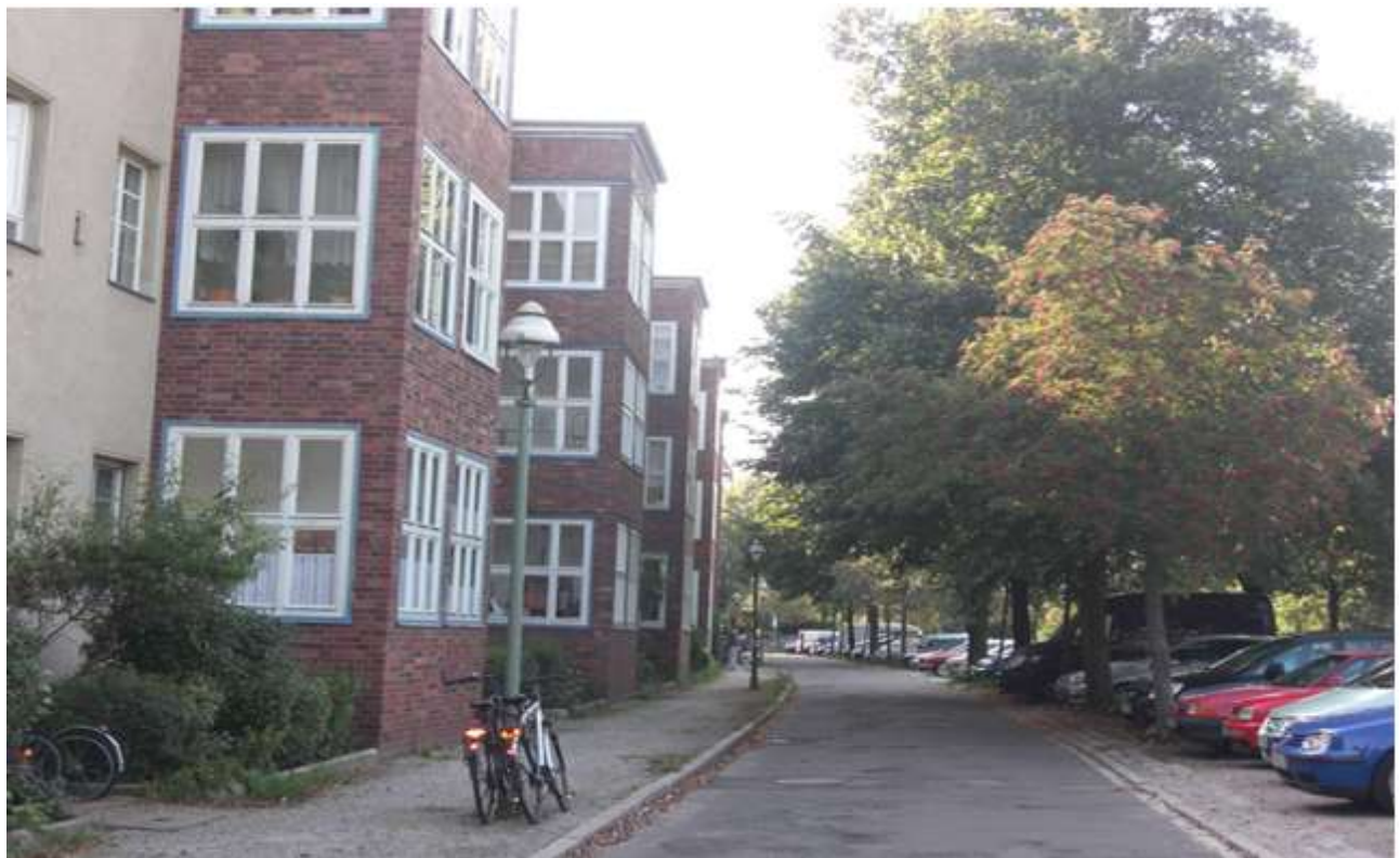
Blick aus der Loggia