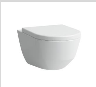
Laufen Pro - Tiefspül-WC, Vollschüssel mit Spüllrand, inkl. Softclose-Deckel