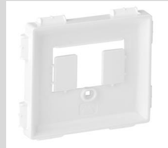
LeGrand Valena™Life ultraweiß Telefonanschlussdose