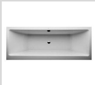
Er&Sie Badewanne z.B. 180x80 cm Hausmarke Firma Klausner (Kundensonderwunsch)