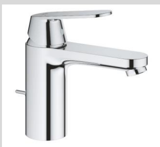
Alternativ: Grohe Eurosmart Cosmopolitan M-Size Einhand-Waschtischarmatur