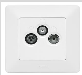
LeGrand Valena™Life ultraweiß TV-R-SAT Dose