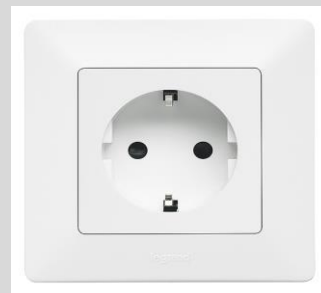
LeGrand Valena™Life ultraweiß Steckdose