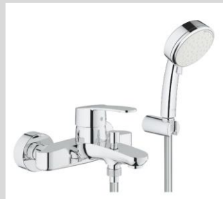
Grohe Eurostyle Cosmopolitan Einhand-Wannenbatterie + Handbrause Tempesta C (Kundensonderwunsch)