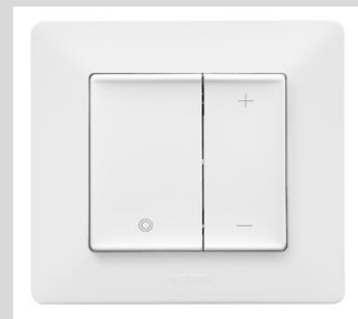
LeGrand Valena™Life ultraweiß Dimmer (Kundensonderwunsch)