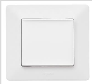
LeGrand Valena™Life ultraweiß Wechselschalter (1-fach-Schalter, Taster)