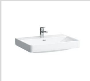
Laufen Pro S Waschtisch 65x48 cm (1-fach oder 2-fach gem. Wohnungseinheit) (Armatur nur beispielhaft)