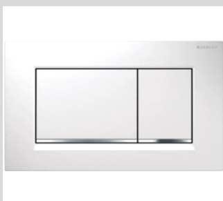
Geberit Betätigungsplatte Sigma 30