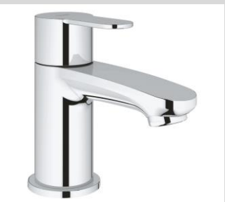
Grohe Eurostyle Cosmopolitan Standventil XS WC-Waschtischmischer