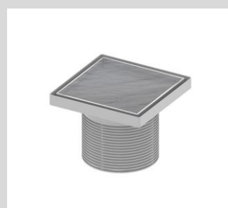
Punktentwässerung mit verfliesbarer Abdeckung