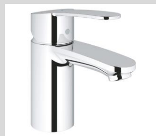
Grohe Eurostyle Cosmopolitan S-Size Einhand-Waschtischarmatur