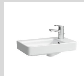
Laufen Pro S WC-Handwaschbecken 48x28 cm (Armatur nur beispielhaft)