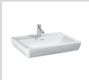
Alternativ: Laufen Pro A Waschtisch 65x48 cm (1-fach oder 2-fach gem. Wohnungseinheit) (Armatur nur beispielhaft)