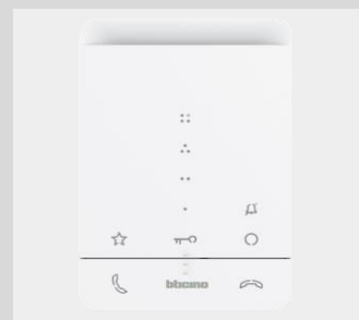
LeGrand | Bticino Audio-Hausstation CLASSE 100 A16E Hörerlose Gegensprechanlage