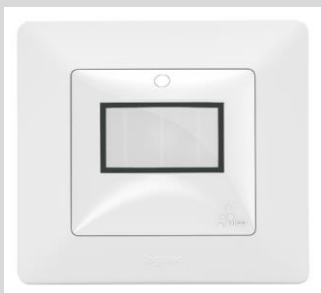
LeGrand Valena™Life ultraweiß Bewegungsmelder (Kundensonderwunsch)