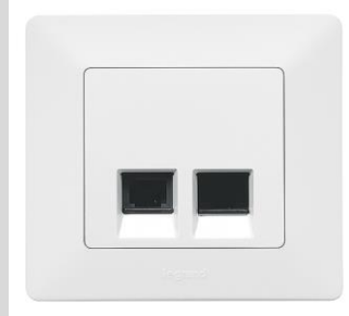
LeGrand Valena™Life ultraweiß RJ11 + RJ45 Dose