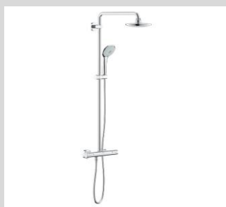
Grohe Euphoria Duschset System 180 mit Thermostatbatterie