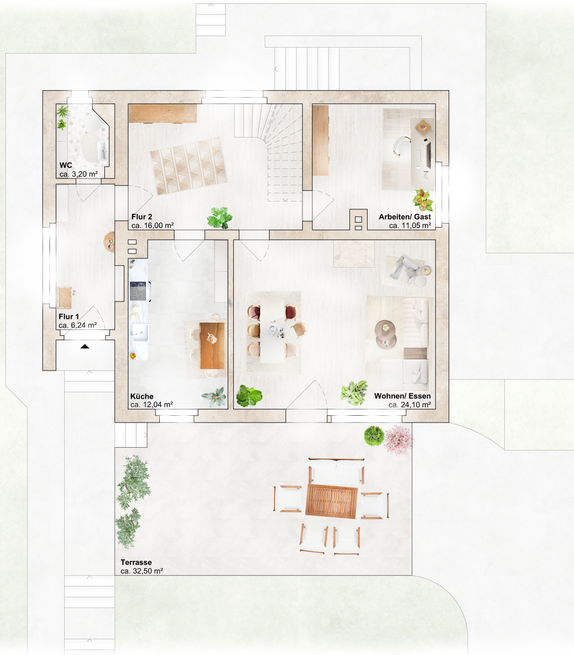
Grundriss EG, M 1:100