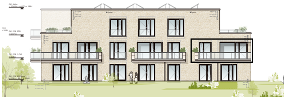
Villa 5 Ansicht Süd

Keine zusätzliche Maklerprovision für den Erwerber.