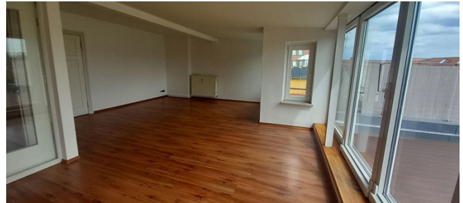
Wohnzimmer Ansicht I