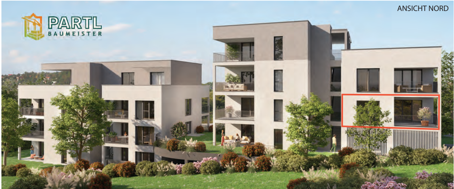
BK 2 ERDGESCHOSS