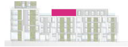
Ostriegel - Ansicht Ost