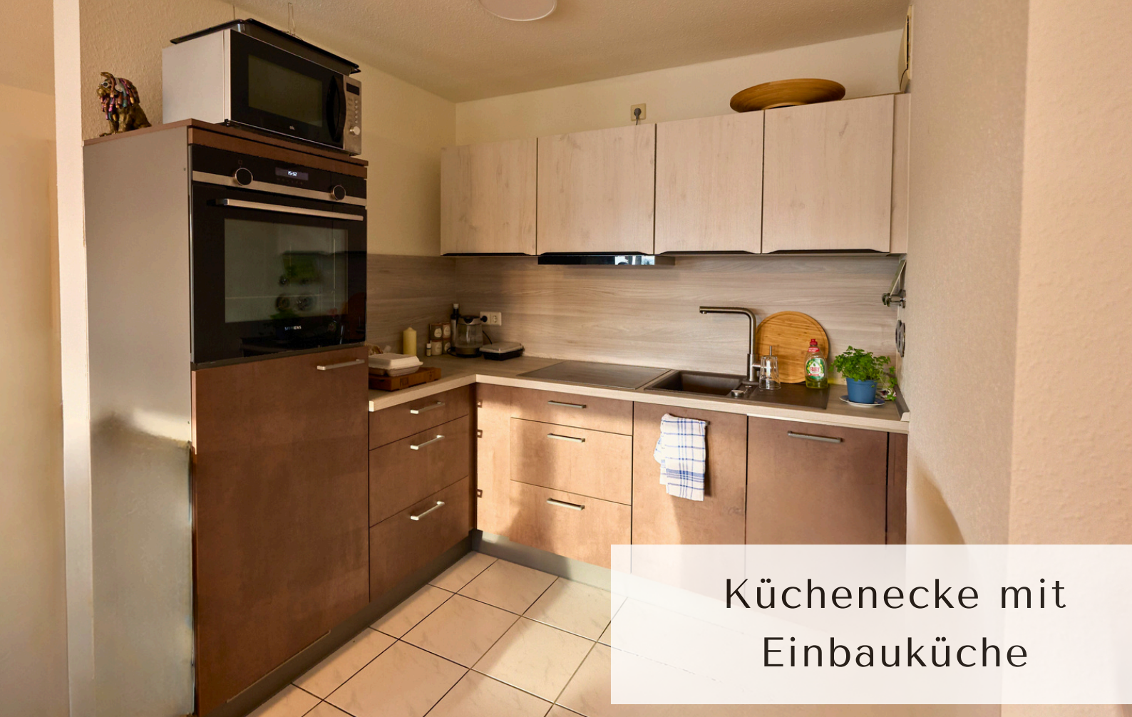
Küchenecke mit Einbauküche