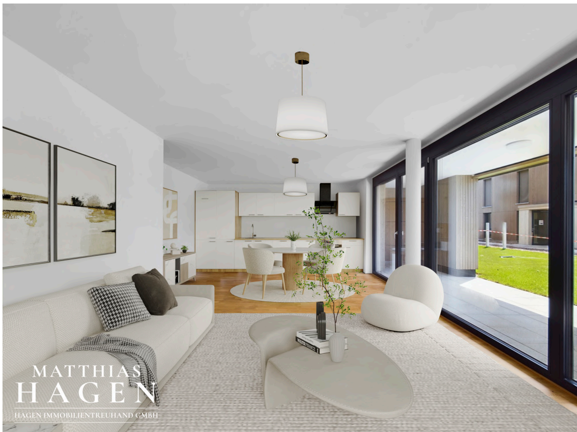
Wohnbereich mit Küche