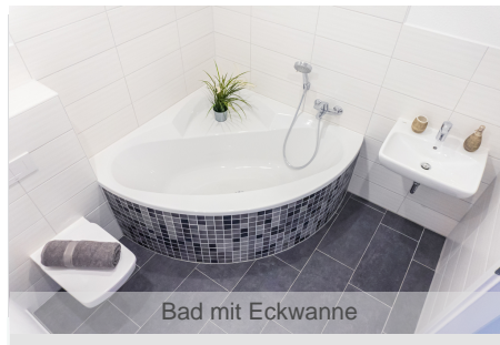
Bad mit Eckwanne