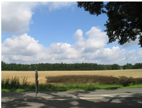
Blick auf die Dorfstraße mit der Insel zur Verkehrsberuhigung nahe dem Grundstück.