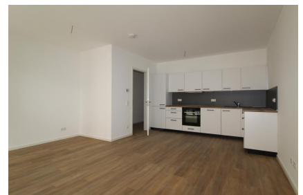
Musterbild Wohn- & Essbereich