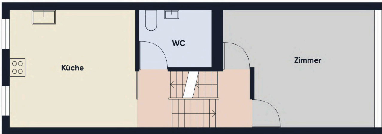
Grundrissplan ohne Maßstab OG