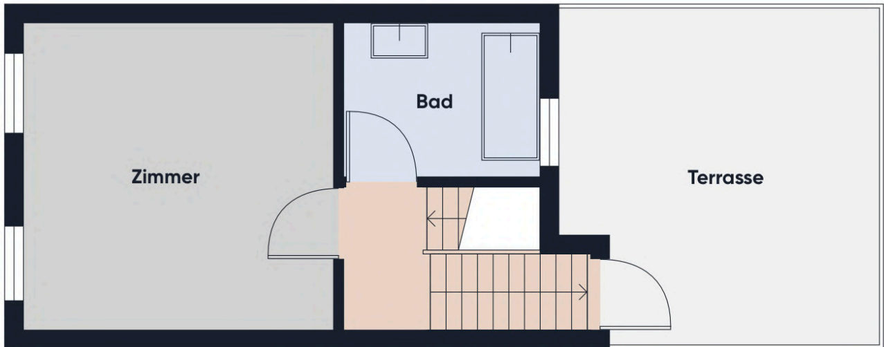
Grundrissplan ohne Maßstab DG