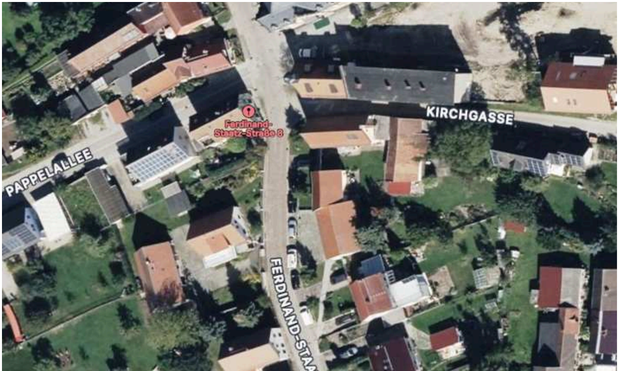
Ferdinand-Staatz-Straße 8, 99438 Bad Berka/ Ortsteil Bergern