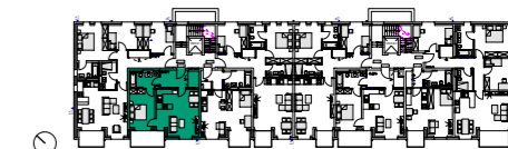
Haus B: Grundriss 1. Obergeschoss