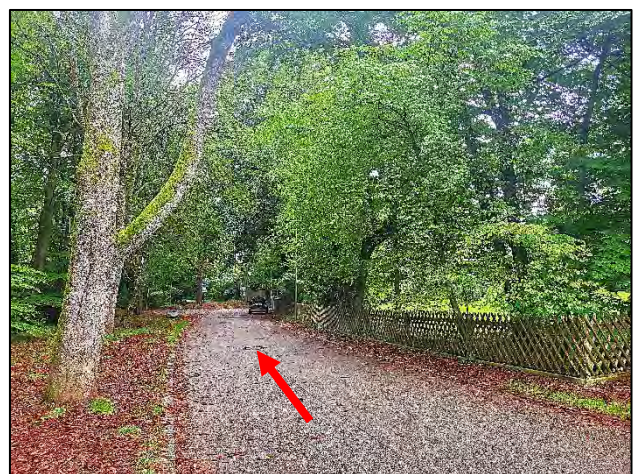
Blick von der Zeillerstraße in Richtung Norden; hier beginnt ein weiterer Wanderweg