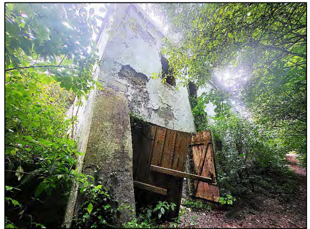
Blick vom Wanderweg auf die Untergeschosse des abrissbedürftigen Gebäudes