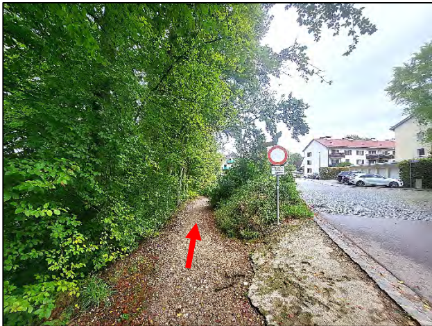
Blick auf den Wanderweg, der an der Westseite direkt neben dem Bewertungsgrundstück verläuft