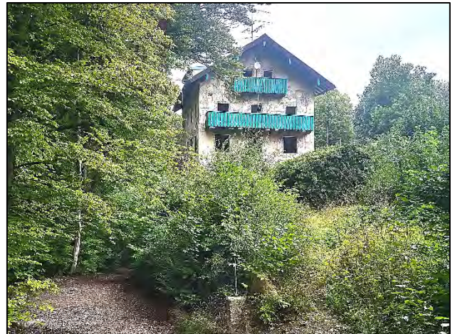
Blick vom Wanderweg auf die Südseite des Gebäudes