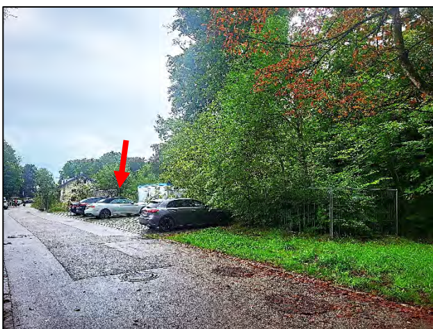
Am Nordostende des Grundstücks befindet sich ein kleiner öffentlicher Parkplatz