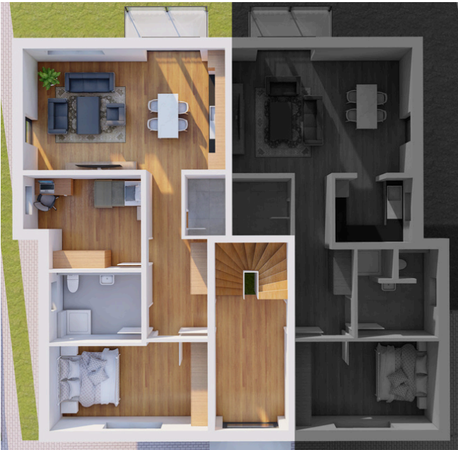
Obergeschoss Wohnung Nummer 3