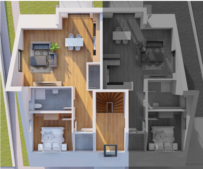
Dachgeschoss Wohnung Nummer 5