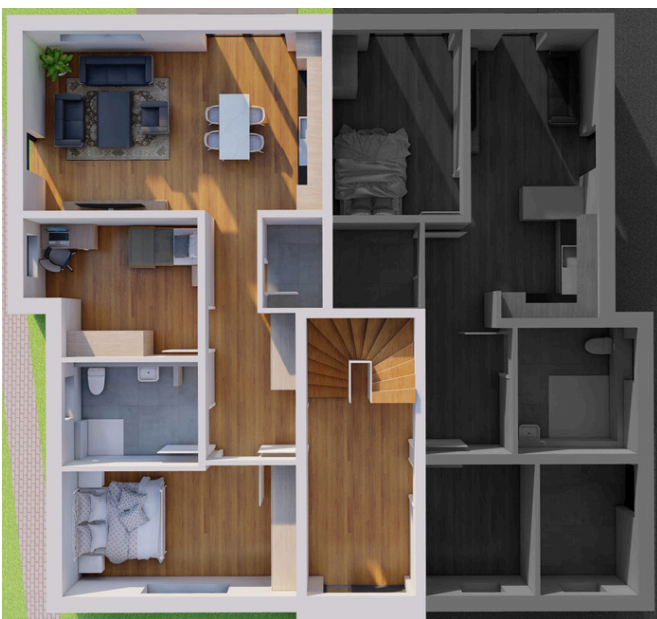
Erdgeschoss Wohnung Nummer 1