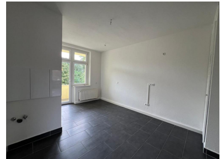
Küche mit Zugang zum Balkon