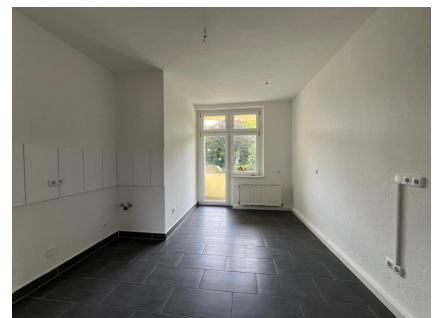
Küche mit Zugang zum Balkon