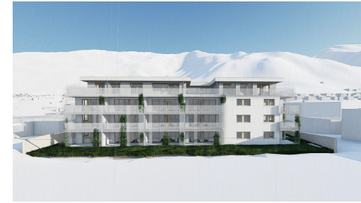
WA STEINA - Steinach am Brenner