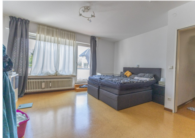
Schlafzimmer mit Zugang zum Balkon