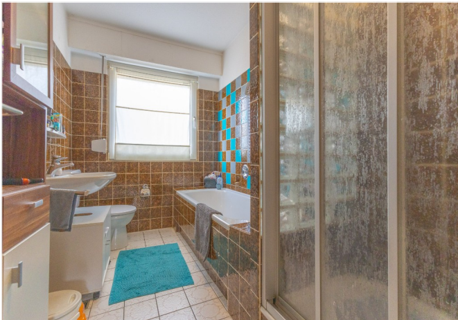
Tageslichtbad mit Badewanne und Dusche