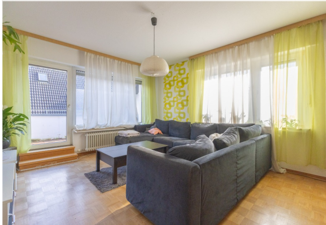
Wohn-Esszimmer mit Zugang zum Balkon