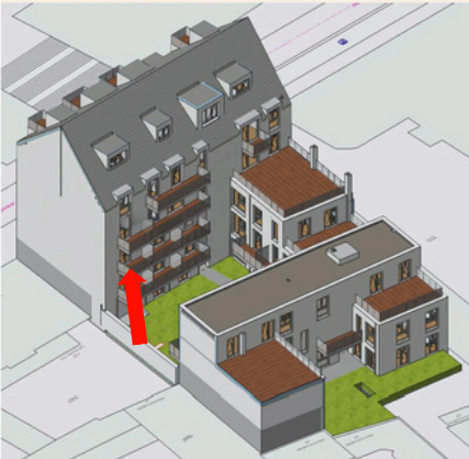
Lage der Wohnung in Haus