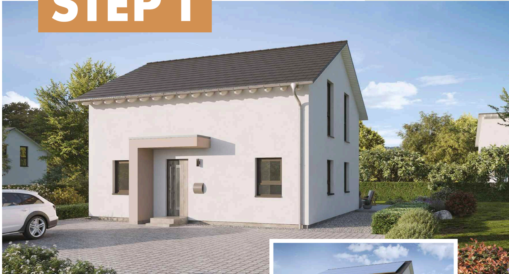
Abbildungen mit Sonderwünschen.