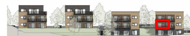
R4 R3 R2 R1