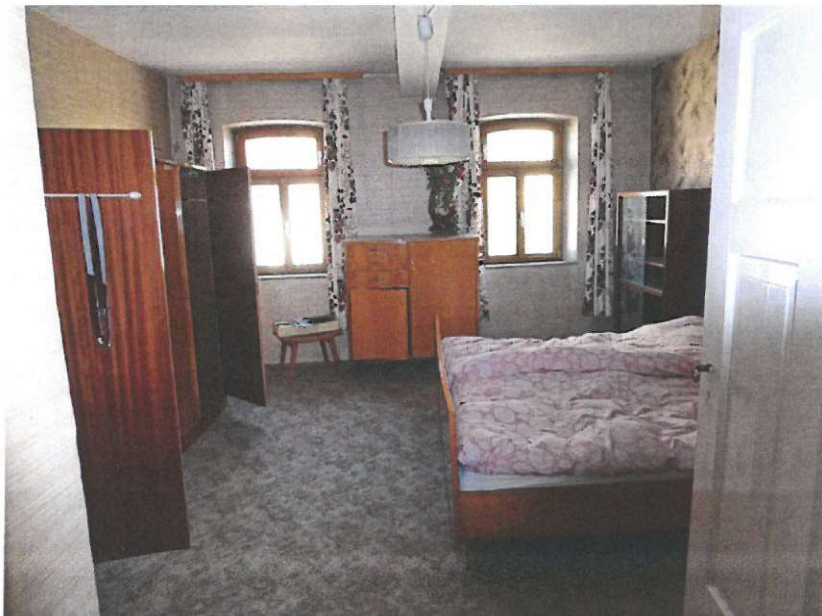
OG schlafen vorn