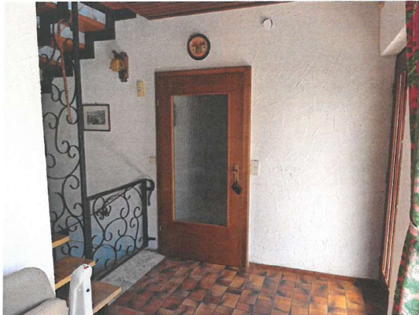
EG Flur Eingang