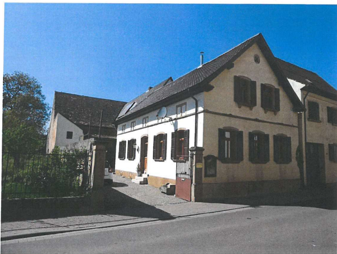
Weinstr. 19, 67273 Herxheim am Berg