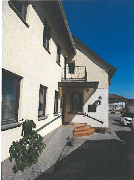
Eingang Haus Rampe