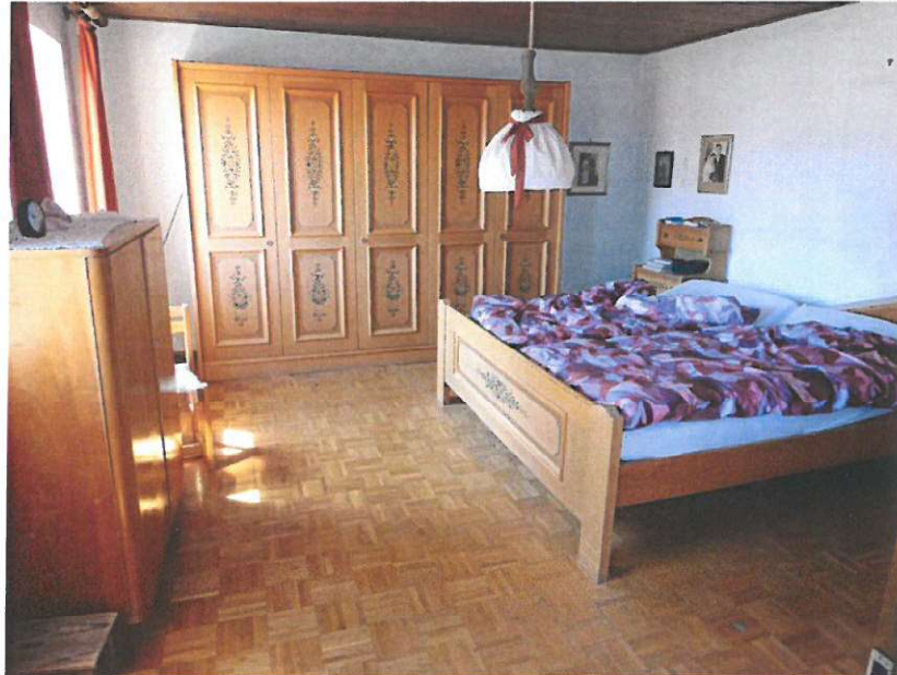
OG schlafen Anbau