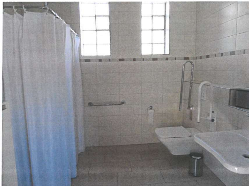
EG Bad Anbau