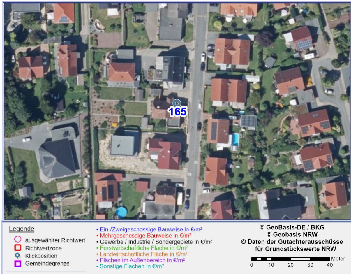
Abbildung 2: Detailkarte gemäß gewählter Ansicht