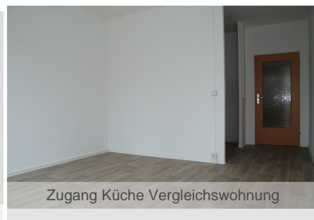
Zugang Küche Vergleichswohnung