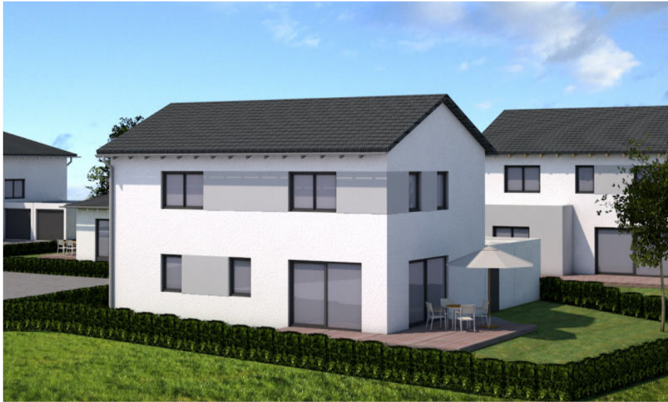
Ansicht von S Ü D - O S T E N