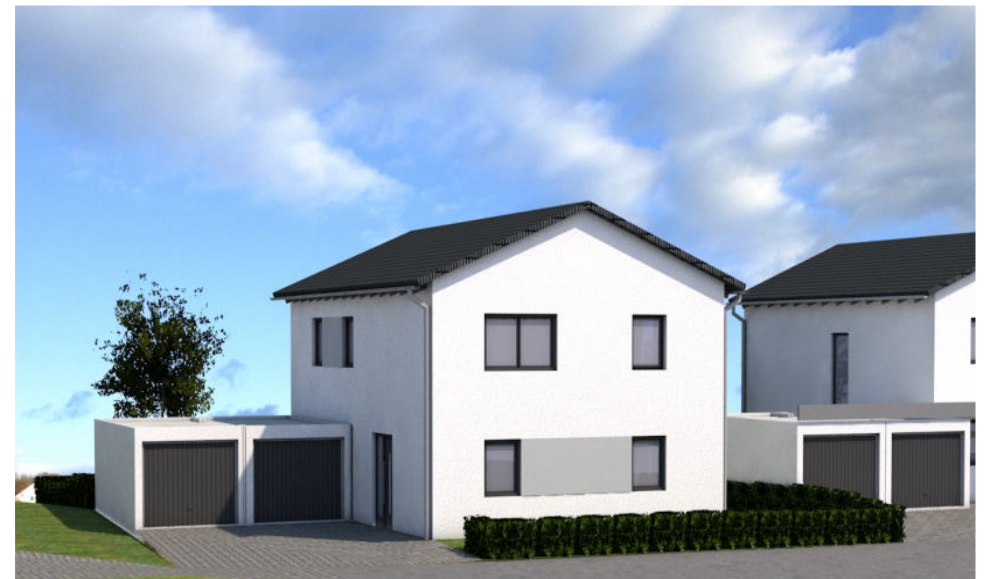
Ansicht von N O R D - W E S T E N