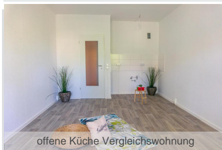
offene Küche Vergleichswohnung