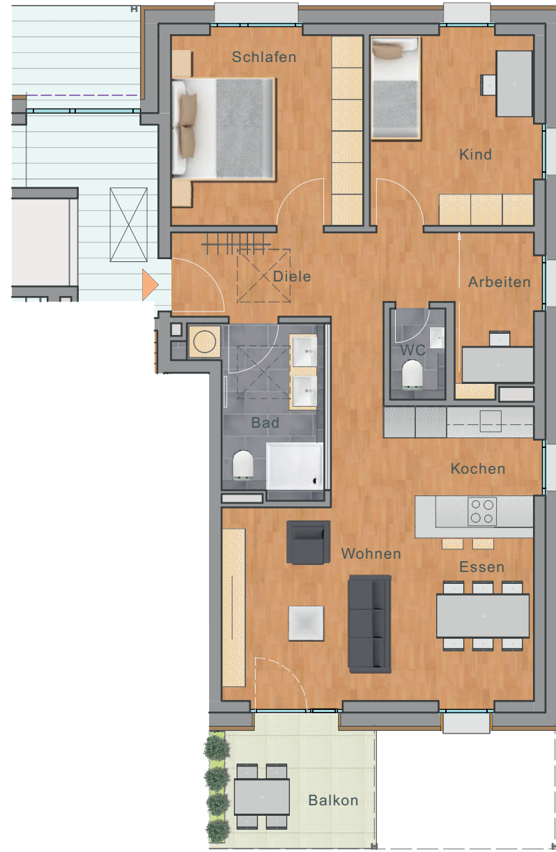
Nachbildung - nicht maßstabsgerecht