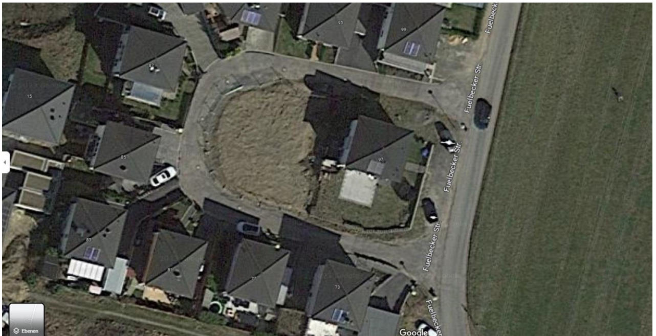
Fuelbeckerstr., 58513 Lüdenscheid