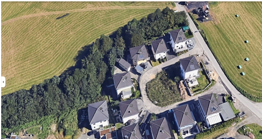
Fuelbecker Str. 01

Alles in der Nähe: Kindergarten, Schule, Einkaufsmöglichkeiten, Ruhiges Wohnen in einem sehr schönen Wohngebiet in der Nähe von der Fuelbecker Talsperre