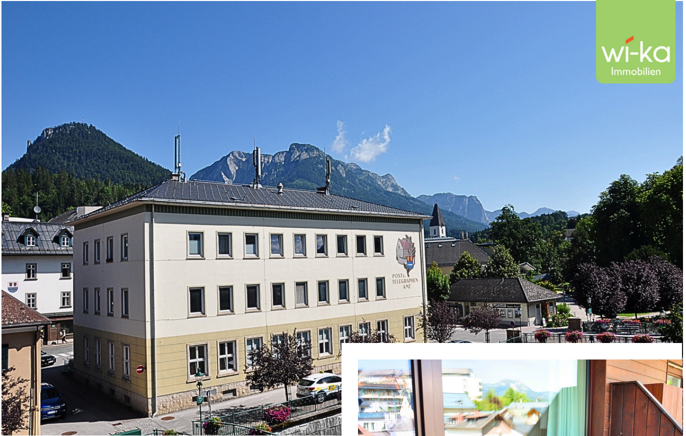
Aussicht Richtung Kurpark