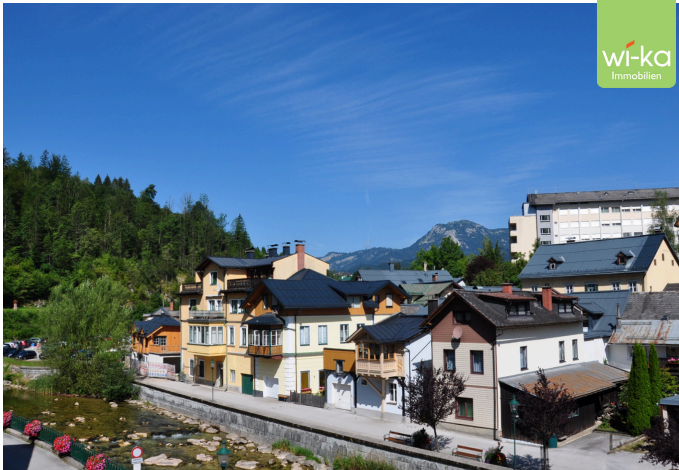
Aussicht Richtung Sandling