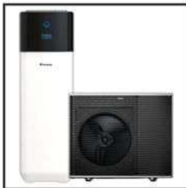
Wärmepumpe Daikin Altherma 4