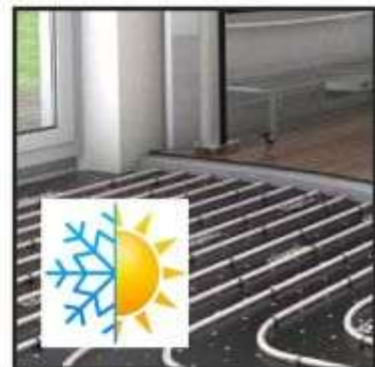
Fußbodenheizung mit Kühlfunktion