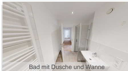
Bad mit Dusche und Wanne