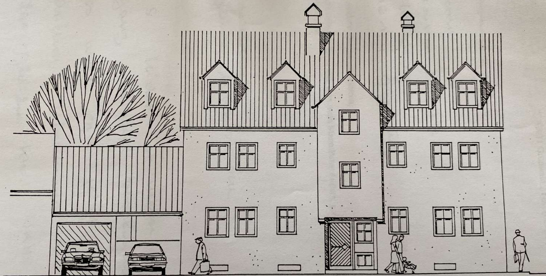
Ansicht von Osten